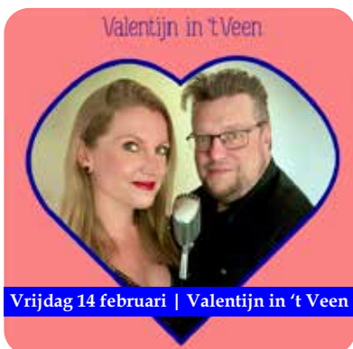
Vrijdag 14 februari | Valentijn in 't Veen