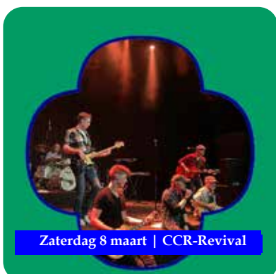
Zaterdag 8 maart | CCR-Revival