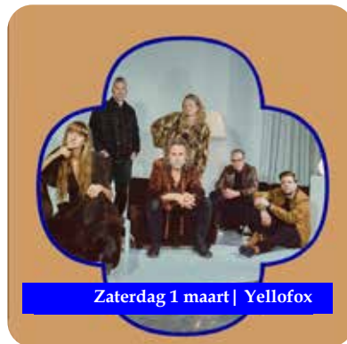
Zaterdag 1 maart | Yellofox