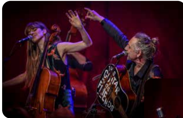
Yellofox | 1maart

Een week later is het de beurt aan CCR-Re- vival. Dit concert is al wekenlang stijf uitver- kocht. Hou de agenda in de gaten en zorg dat je snel je kaarten voor de andere concerten re- gelt, zodat ook jij kan genieten van een avond muziek en gezelligheid bij d'Rentmeester!